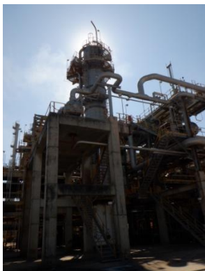
รูปที่ 3-3 Amine Regeneration Unit