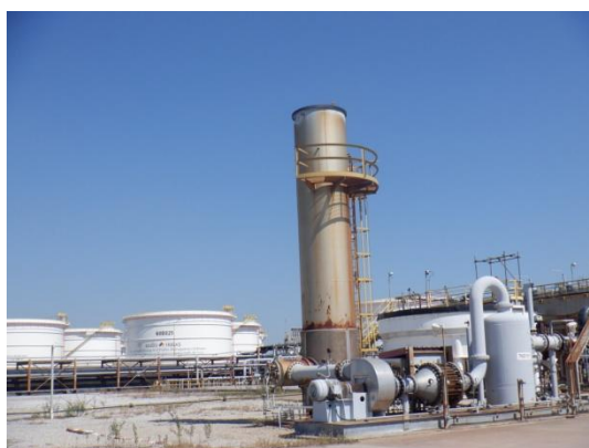
รูปที่ 3-23 ETP Ground Flare

ภาพถ่ายประกอบการปฏิบัติตามมาตรการป้องกันและแก้ไขผลกระทบสิ่งแวดล้อม