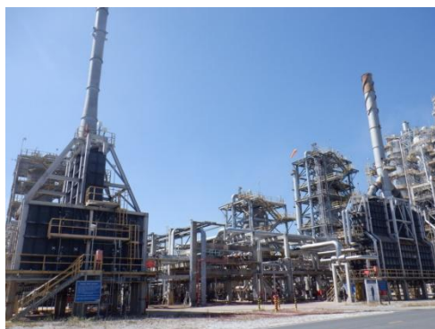
รูปที่ 3-5 HVGO Hydrotreating Unit