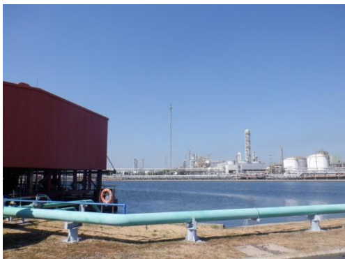
รูปที่ 3-27 บ่อน้ำดับเพลิง