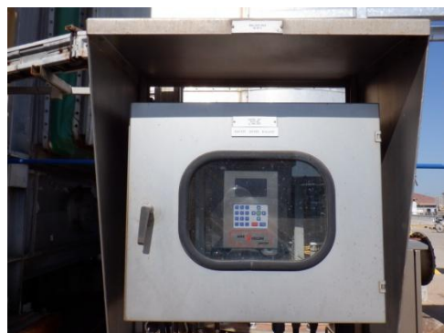
รูปที่ 3-7 Oxygen Analyzer