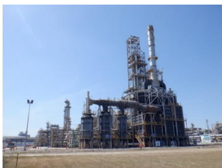
Platformer & CCR