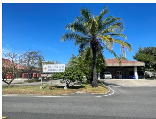
รูปที่ 3-36 สถานพยาบาล

ภาพถ่ายประกอบการปฏิบัติตามมาตรการป้องกันและแก้ไขผลกระทบสิ่งแวดล้อม (ระยะดำเนินการ) โครงการโรงกลั่นน้ำมัน บริษัท สตาร์ ปิโตรเลียม รีไฟน์นิ่ง จำกัด (มหาชน)