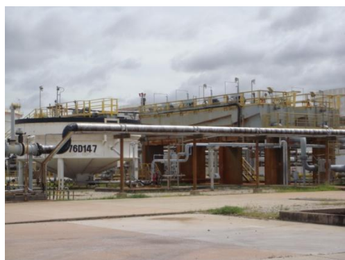
หน่วยแยกน้ำมันออกจากน้ำเสีย (Induced Air Flotation Unit)