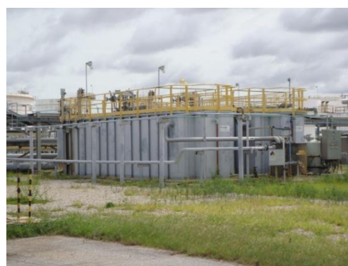
ระบบบำบัดน้ำเสียจากอาคารสำนักงาน (Sanitary System)