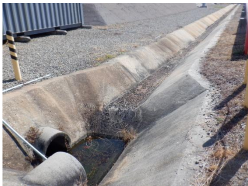
รูปที่ 3-31 รางระบายน้ำแบบเปิด