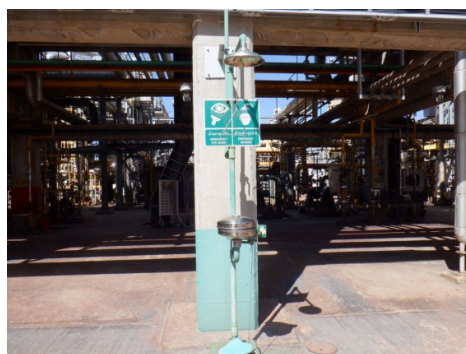
รูปที่ 3-39 ฝักบัวและอ่างล้างตาฉุกเฉิน