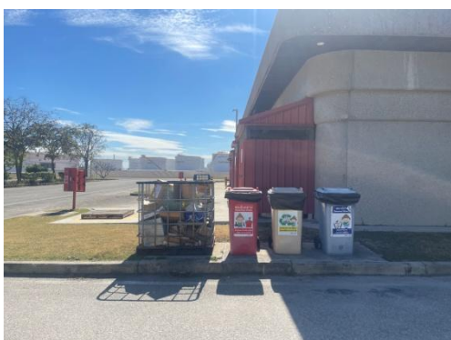
รูปที่ 3-29 ภาชนะบรรจุกากของเสียแยกประเภท