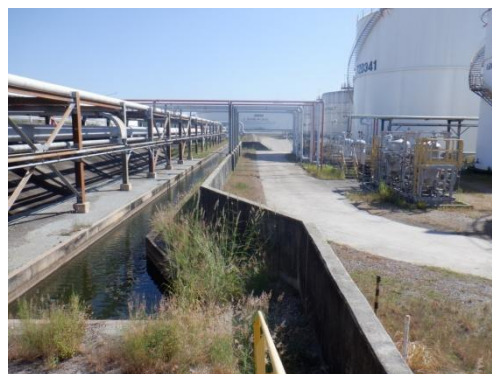
รูปที่ 3-47 คันกั้นของถังเอธานอล

ภาพถ่ายประกอบการปฏิบัติตามมาตรการป้องกันและแก้ไขผลกระทบสิ่งแวดล้อม