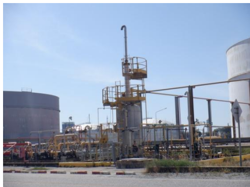
รูปที่ 3-19 Caustic Scrubber