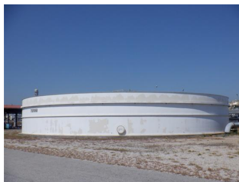
บ่อตกตะกอน (Bioreactor Clarifier)