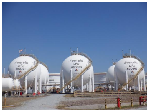
รูปที่ 3-55 ถัง LPG