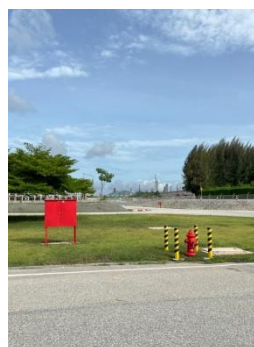
รูปที่ 3-50 ตัวอย่างอุปกรณ์ป้องกันและระงับอัคคีภัย

ภาพถ่ายประกอบการปฏิบัติตามมาตรการป้องกันและแก้ไขผลกระทบสิ่งแวดล้อม (ระยะดำเนินการ) โครงการโรงกลั่นน้ำมัน บริษัท สตาร์ ปิโตรเลียม รีไฟน์นิ่ง จำกัด (มหาชน)