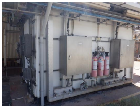
รูปที่ 3-9 CEMS ของปล่อง Tail Gas Treatment Unit