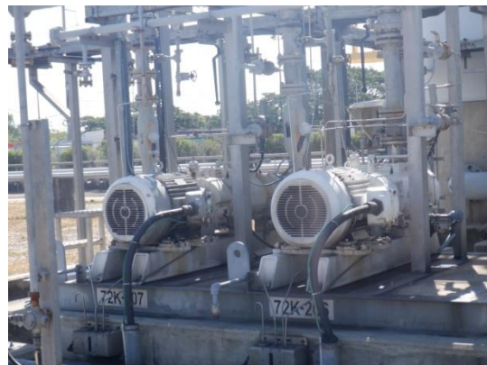
รูปที่ 3-25 Pump/Blower ของ VRU