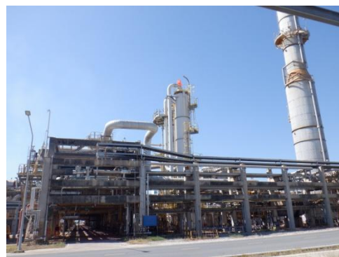
รูปที่ 3-6 Tail Gas Treatment Unit