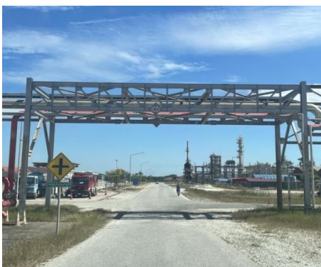
รูปที่ 3-53 Pipe Rack สำหรับท่อขนส่งน้ำมัน