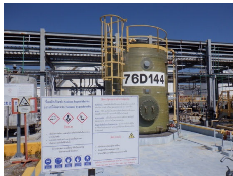
รูปที่ 3-38 ป้ายแสดงข้อมูลความปลอดภัย ของสารเคมี