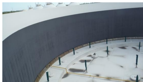
รูปที่ 3-54 ระบบกันระเหย 2 ชั้น (Double Seal) ที่ Floating Roof Tank

ภาพถ่ายประกอบการปฏิบัติตามมาตรการป้องกันและแก้ไขผลกระทบสิ่งแวดล้อม (ระยะดำเนินการ) โครงการโรงกลั่นน้ำมัน บริษัท สตาร์ ปิโตรเลียม รีไฟน์นิ่ง จำกัด (มหาชน)