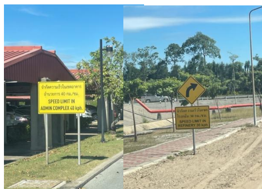
รูปที่ 3-34 ป้ายจำกัดความเร็ว