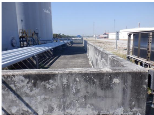
รูปที่ 3-48 คั่นกันของถัง B100