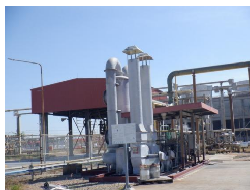
รูปที่ 3-18 Scrubber ที่ Sulfur Tank

ภาพถ่ายประกอบการปฏิบัติตามมาตรการป้องกันและแก้ไขผลกระทบสิ่งแวดล้อม