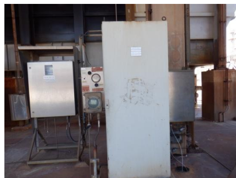
รูปที่ 3-8 CEMS ของปล่อง RFCCU

ภาพถ่ายประกอบการปฏิบัติตามมาตรการป้องกันและแก้ไขผลกระทบสิ่งแวดล้อม