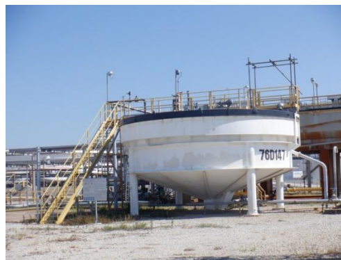
หน่วยแยกน้ำมันออกจากน้ำเสีย (API Separator Unit)