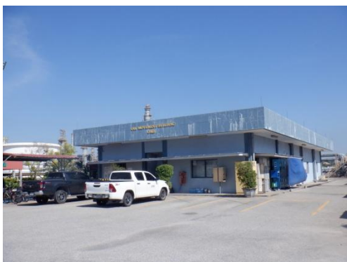
รูปที่ 3-44 ห้องปรับอากาศ