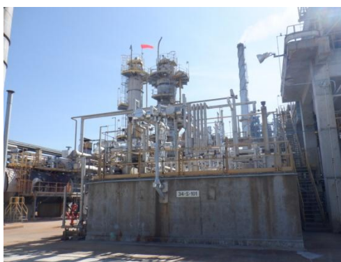
รูปที่ 3-10 ระบบตรวจอากาศจากบ่อซัลเฟอร์