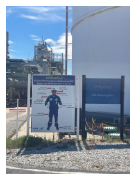
รูปที่ 3-42 ป้ายเตือนสวมใส่อุปกรณ์คุ้มครอง ความปลอดภัยส่วนบุคคล

ภาพถ่ายประกอบการปฏิบัติตามมาตรการป้องกันและแก้ไขผลกระทบสิ่งแวดล้อม (ระยะดำเนินการ) โครงการโรงกลั่นน้ำมัน บริษัท สตาร์ ปิโตรเลียม รีไฟน์นิ่ง จำกัด (มหาชน)