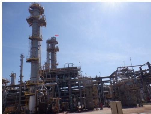
รูปที่ 3-4 Sour Water Stripping Unit