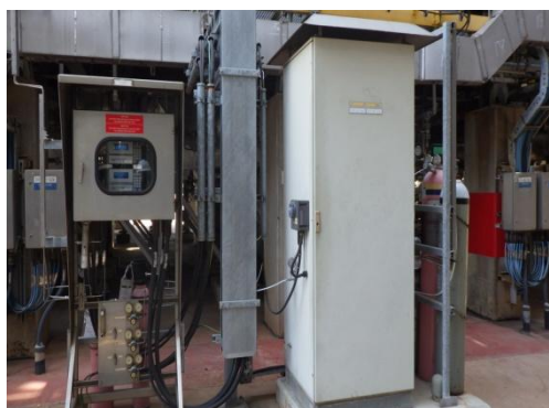
รูปที่ 3-15 CEMS ของปล่อง VDU