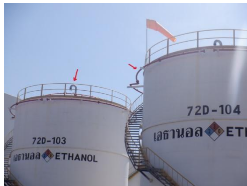
รูปที่ 3-49 Safety Valve และ Water Spray ของถังเอทานอล