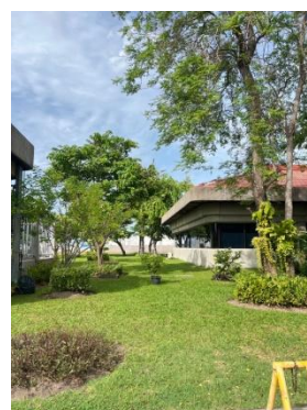
รูปที่ 3-56 พื้นที่สีเขียว

ภาพถ่ายประกอบการปฏิบัติตามมาตรการป้องกันและแก้ไขผลกระทบสิ่งแวดล้อม (ระยะดำเนินการ) โครงการโรงกลั่นน้ำมัน บริษัท สตาร์ ปิโตรเลียม รีไฟน์นิ่ง จำกัด (มหาชน)