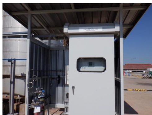
รูปที่ 3-12 CEMS ของปล่อง HRSG

ภาพถ่ายประกอบการปฏิบัติตามมาตรการป้องกันและแก้ไขผลกระทบสิ่งแวดล้อม