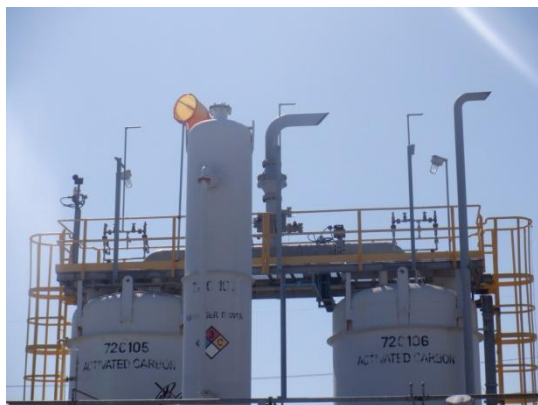
รูปที่ 3-24 Outlet ของ VRU