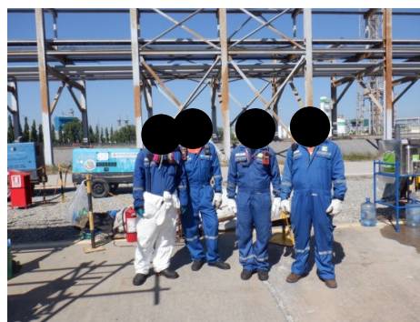
รูปที่ 3-40 พนักงานสวมใส่อุปกรณ์คุ้มครอง ความปลอดภัยส่วนบุคคล