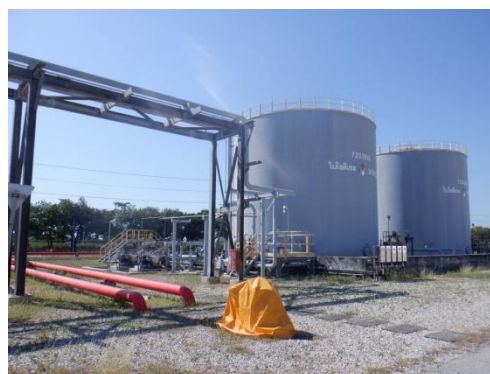
รูปที่ 3-52 อุปกรณ์ป้องกันและระงับอัคคีภัย บริเวณถัง B100