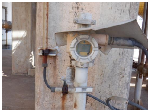
รูปที่ 3-20 H 2 S Detector