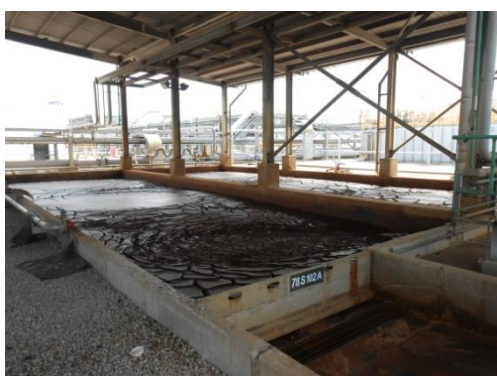
หน่วยบำบัดรวบรวมกากจุลินทรีย์ (Bio-Sludge Digester)