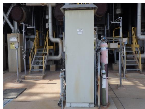
รูปที่ 3-16 CEMS ของปล่อง NHTU/CCRU