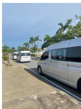
รูปที่ 3-35 รถรับ-ส่งพนักงานและคนงาน