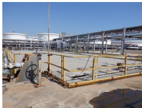
รูปที่ 3-22 ฝापิดที่ API Oil/Water Separator