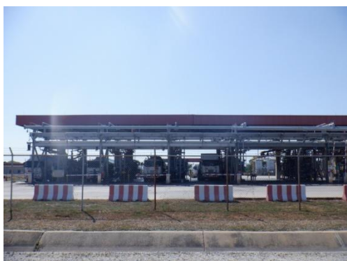
รูปที่ 3-51 สถานีสูบน้ำทางรถ