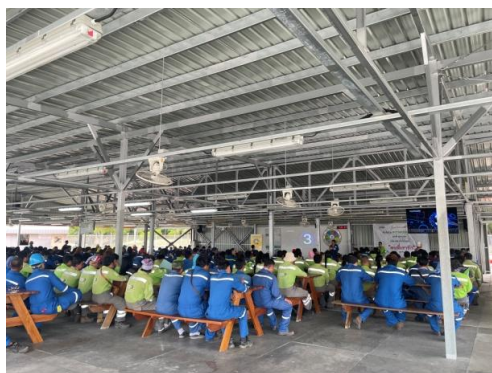
รูปที่ 3-45 การประชุมประจำวันของผู้รับเหมา