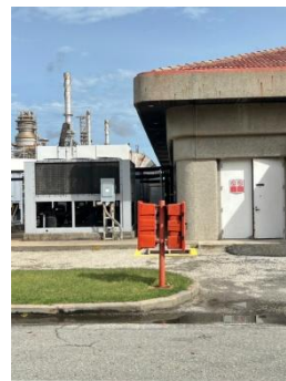
รูปที่ 3-50 ตัวอย่างอุปกรณ์ป้องกันและระงับอัคคีภัย (ต่อ)