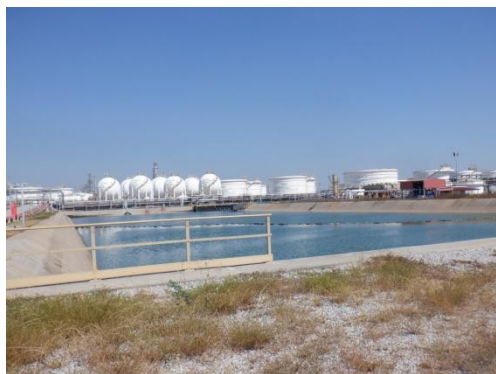
บ่อรวบรวมน้ำฝนที่มีโอกาสปนเปื้อน (Potentially Contaminated Storm Water Holding Pond)