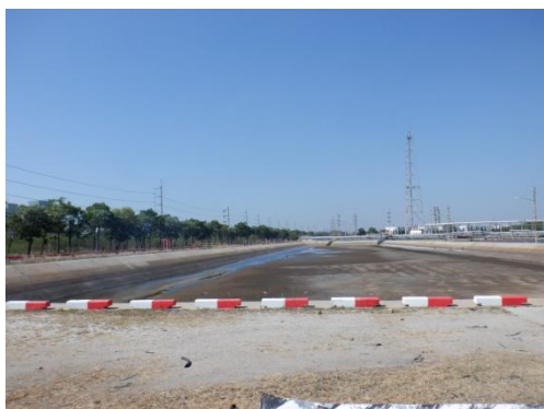
บ่อพักน้ำเสียที่ผ่านการบำบัดแล้ว (Polishing Pond)