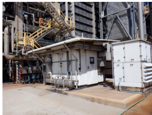
รูปที่ 3-14 CEMS ของปล่อง CDU