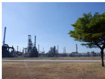
ภาพรวมของโรงกลั่นน้ำมัน