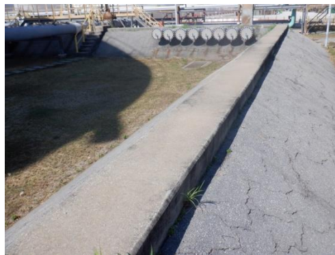
รูปที่ 3-32 คันกั้นบริเวณพื้นที่ลานถังกักเก็บ