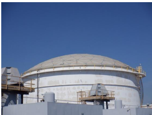
รูปที่ 3-21 ฝารอบถัง Equalization เพื่อลดกลิ่น