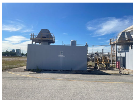
รูปที่ 3-41 Enclosure