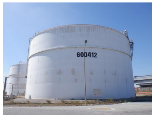
Sour Water Feed Tank