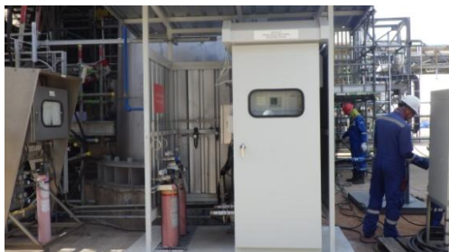
รูปที่ 3-13 CEMS ของปล่อง Boiler