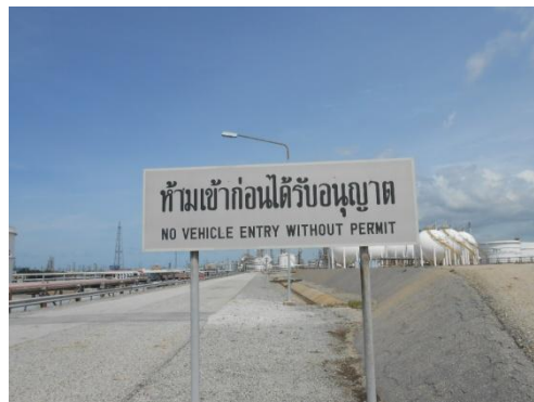
รูปที่ 3-43 ป้ายแสดงเขตพื้นที่หวงห้าม