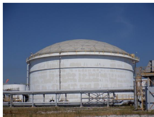
บ่อปรับสภาพน้ำเสียก่อนเข้าหน่วยเดิมอากาศ (Equalization Tank)