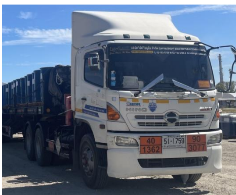
รูปที่ 3-33 การติดหมายเลขโทรศัพท์ที่รถขนส่ง