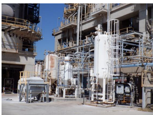
รูปที่ 3-17 DeSO x Catalyst ที่ RFCCU