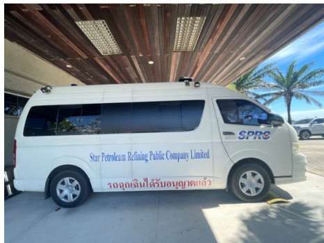
รูปที่ 3-37 รถพยาบาล