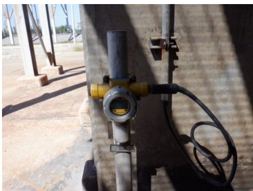
รูปที่ 3-46 Gas Detector