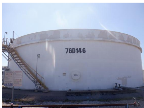
บ่อเติมอากาศ (Bioreactor Tank)